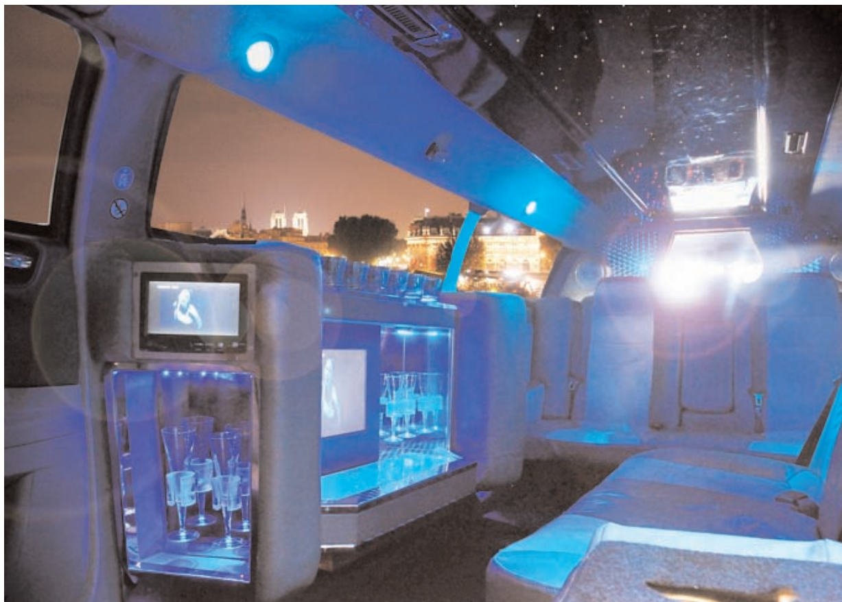
L'intérieur coquet de cette Limousine n'attend que ses tourtereaux

De mon côté, heureusement, je n'ai jamais eu de problème de cette nature. En revanche, il m'est arrivé d'entamer des poursuites judiciaires à l'encontre d'entrepreneurs véreux qui tentaient de