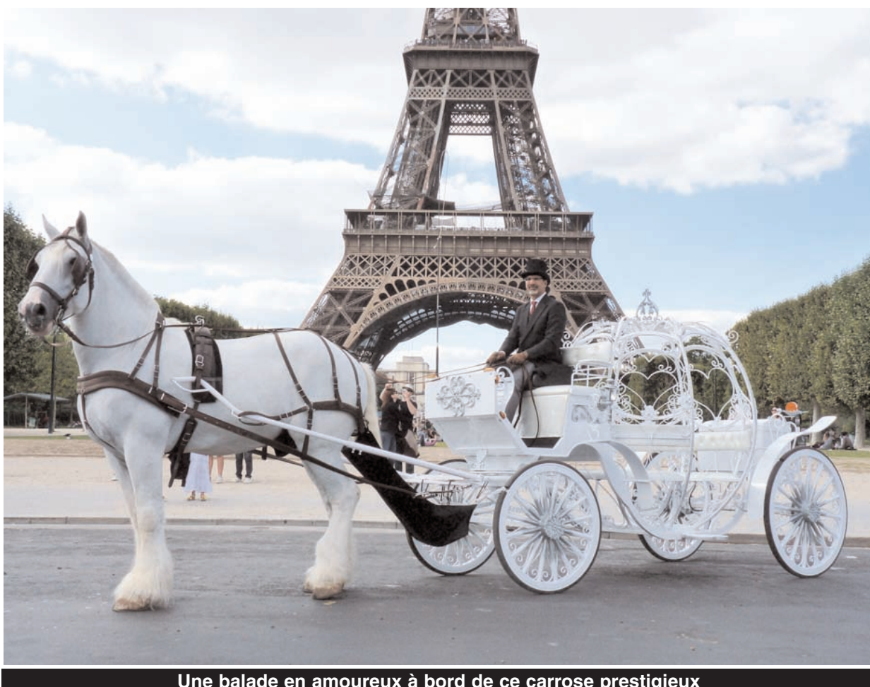
Une balade en amoureux à bord de ce carrosse prestigieux

Pour l'instant, mes prestations romantiques ne sont disponibles qu'à Paris, mais, dans le futur, je proposerai peut-être mes services dans d'autres capitales internationales. Je dois, toutefois, encore étudier le sujet, puisque, depuis six ans, je consacre véritablement l'intégralité de mon temps aux trois millions de couples qui viennent, chaque année, se dire je t'aime à Paris. Ce n'est pas pour cela que mon travail est franco-français, bien au contraire ! Si ma mission quotidienne est d'aider les amoureux du monde entier à vivre, à Paris, un véritable conte de fées, j'ai pour seul objectif qu'ils repartent chez eux avec les yeux remplis d'étoiles !