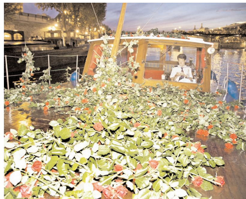
Une pluie de roses pour sa dulcinée, ça vaut la peine

Je suis vraiment ravi et fier que le message universel de l'amour que je tente, depuis des années, de véhiculer, puisse atteindre un média burkinabè. Et je suis toujours épaté de voir que les déclarations d'amour que j'organise à Paris puissent ainsi faire le tour du monde ! C'est, pour moi, une véritable satisfaction. D'ailleurs, depuis le lancement de mon activité insolite, j'ai eu la chance d'obtenir des articles de presse dans près de 45 pays à travers le monde, dont certains en Afrique (Afrique du Sud, Mali, Niger et Togo). Mais le fait de pouvoir toucher un média du Burkina Faso est, pour moi, particulièrement