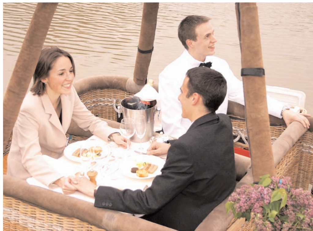
La Mongolfiere, un moyen insolite pour déclarer sa flamme à son partenaire

Ayant inventé le concept de A à Z, puisque rien de tel n'existait en France comme à l'étranger, j'ai dû consacrer plus de deux ans à la mise en forme du projet, avant de pouvoir ouvrir mon agence et mon site Internet. J'ai notamment travaillé avec le concours de psychosociologues, pour comprendre comment la déclaration d'amour fonctionnait et quelles étaient les différentes étapes psychologique à respecter pour que l'expérience vécue par mes clients soit la plus extraordinaire et la plus intense de leur vie. J'ai également dû rencontrer de nombreux prestataires de prestige, et les convaincre du sérieux de ma démarche. Et, à ma plus grande surprise, tous ont joué le jeu. Le Musée Grévin, par exemple, a accepté de mettre en place un scénario commun, avec une fausse statue de Saint-Valentin prenant vie sous les yeux des amoureux pour remettre, à la jeune femme, une rose et un message d'amour personnalisé. Pour donner un autre