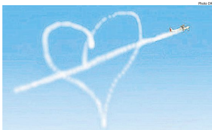
La plus chère des prestations : la patrouille aérienne, pour 15 900 €.