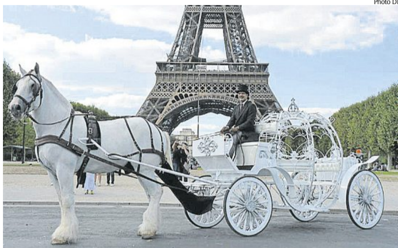
Déclarer son amour à bord du carrosse de Cendrillon coûtera 1 990 €.