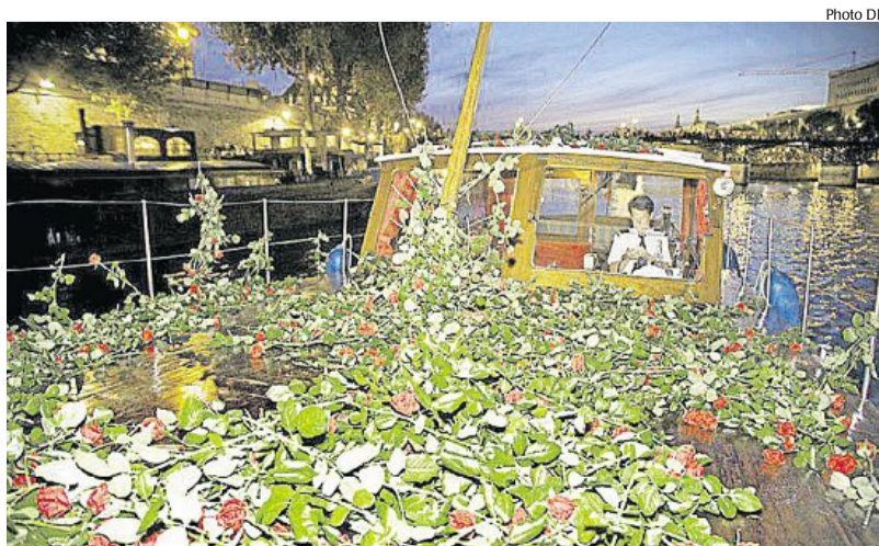
La soirée en Bentley et chaloupe privée sous une pluie de mille roses : 5 490 €.