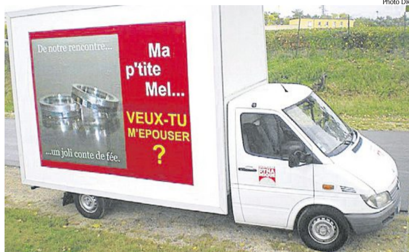
Lui dire « Je t'aime » sur un camion publicitaire garé devant chez elle : 1 490 €.

Le Samedi 16 Février www.librairie-richier.com 6-8 rue Chaperonnière - Angers